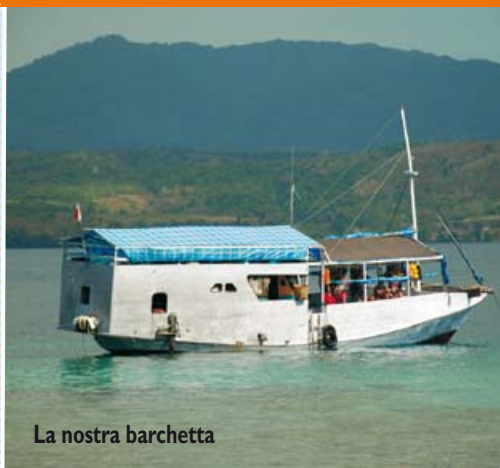
La nostra barchetta

grandi ponti dove vivere, condividere questo viaggio e tutto diventa comunitario ancora di più.