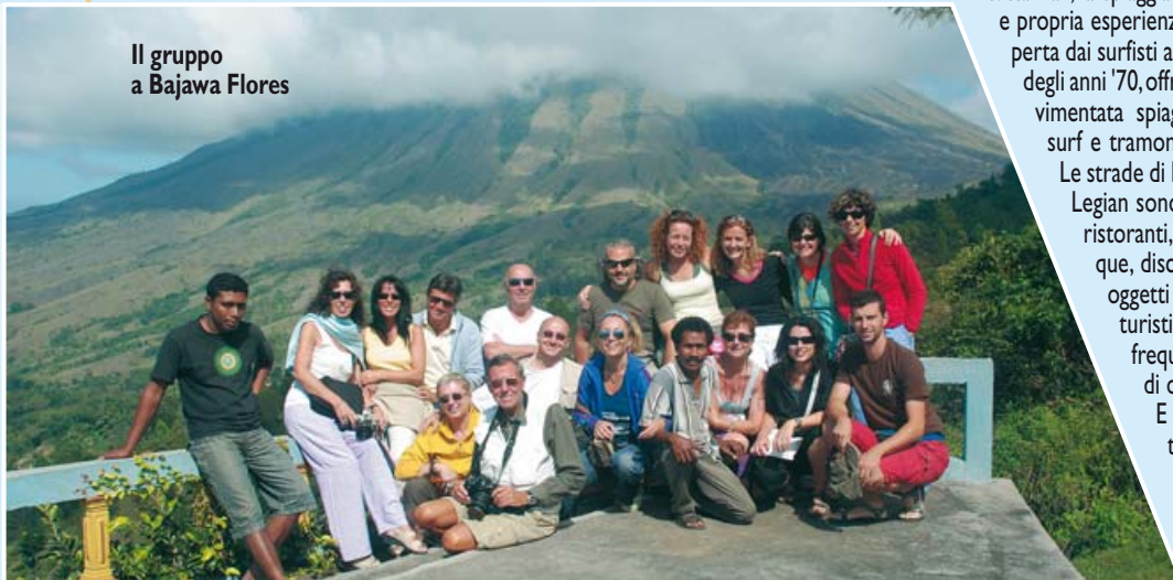
Il gruppo a Bajawa Flores