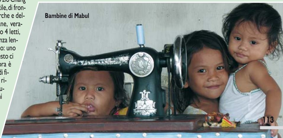
Bambine di Mabul

La storia ci insegna quanta strada dobbiamo fare quando ci sono muri da abbattere, recinti da aprire, reti da buttare giù...anche qui il mondo si divide in due. Da una parte i locali, con le loro baracche, le loro capanne ed i tanti bambini; dall'altra i turisti, assetti nei loro resort che circondano il villaggio come un anello esterno. Resort di legno scuro (i tanti alberi ultra giganteschi della vicina foresta del Borneo), con passerelle bellissime che avanzano sul mare cristallino e trasparente...dal pontile di questi resort si può vedere nitidamente il fondale con le sue stelle marine enormi ed i pesci variopinti che