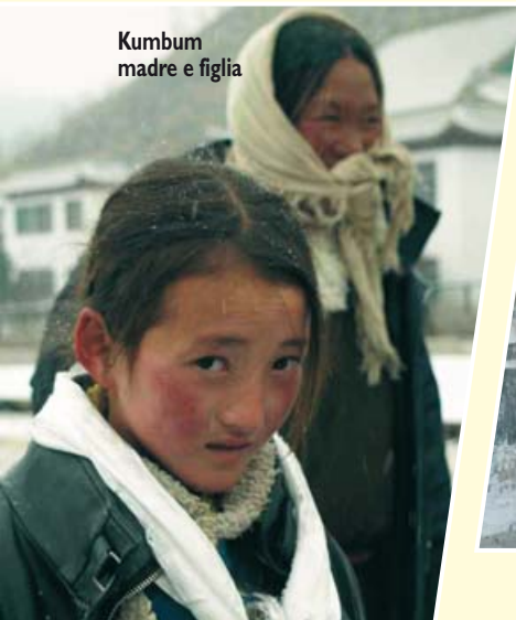
Kumbum madre e figlia