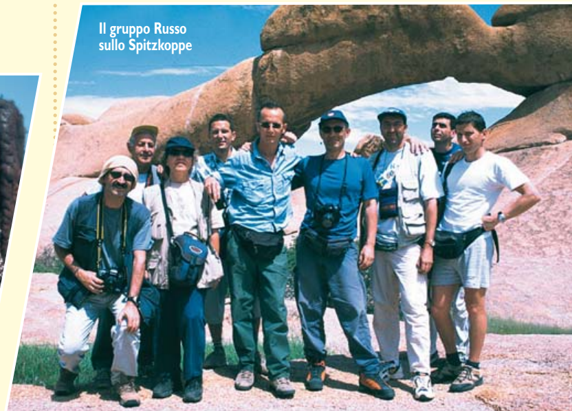
Il gruppo Russo sullo Spitzkoppe

Dopo aver chiuso la cena con delle ottime nespole decidiamo il programma del giorno dopo (con non pochi problemi!!): sveglia alle ore 7 per visitare la cittadina alla scoperta dell'artigianato locale.