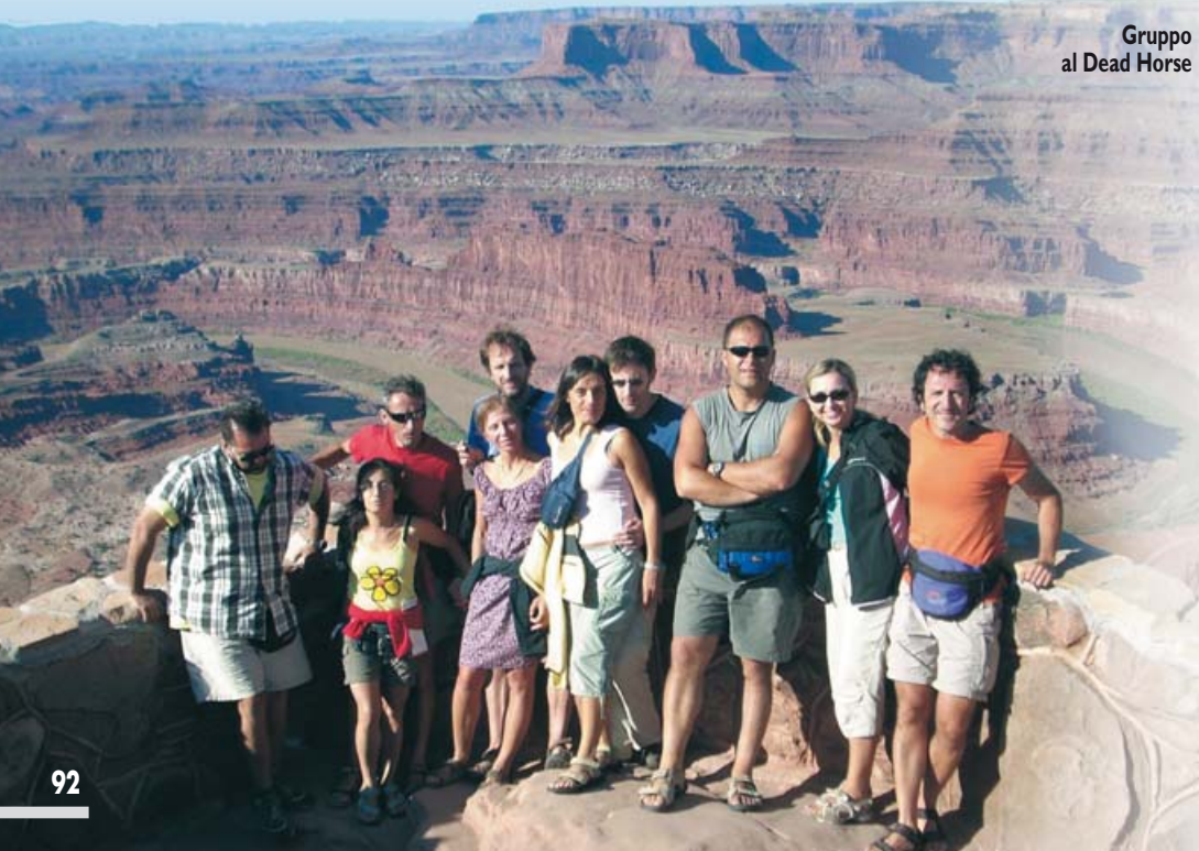
Gruppo al Dead Horse

Domenica 10 agosto, oggi ci aspetta l'attraversamento della valle della morte (Death Valley) con arrivo a Las Vega, sono 460 miglia, organizziamo delle scorte di acqua e di cibo, la valle ha un che di paesaggio lunare con monta- gne superiori a 3000 mt e vallate che scendono sotto il li- vello del mare lasciando una lunga scia di salsedine che dall'alto delle montagne sembra latte sparso. In questa val- le si trovano delle miniere dismesse di borace con i rela- tivi insediamenti, la temperatura nella valle è molto eleva- ta, non è possibile rimanere al sole senza copertura la tem-