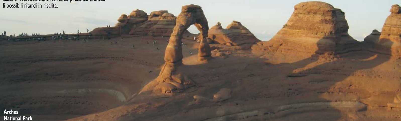
Arches National Park

Sabato 24 agosto. Dopo il bivaccamento in aeroporto e le solite trafale per l'imbarco, alle 07.00 partiamo per Atlanta e il gruppo si divide, chi parte per Milano e chi per Roma, ci salutiamo affettuosamente; le tre settimane trek nei parchi sono state indimenticabili. ■