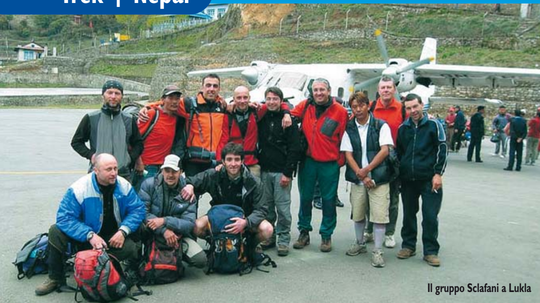
Il gruppo Sclafani a Lukla

io abbia mai conosciuto, dentro e fuori Adventure. Grazie. Lassù a Namche Bazar forse sembravamo un lord con il suo portatore, quando in quello strano mercato affacciato sul vuoto siamo andati a far scorta di birre per il trekking! -250 Rupie una birra nei lodge? Come un pasto? Eh no: 90 al mercato!- Pesavano, però! Ce le siamo divise, poi, un po' tu, un po' io, e il resto ai poveri Qui-Quo-Qua; e via! E via anche ora: -Via, Ano!-; giù dal Cho La, verso il ghiacciaio lontano laggiù, che dobbiamo attraversare per arrivare fin sotto agli 8200 del Cho Oyu: La Dea Turchese.