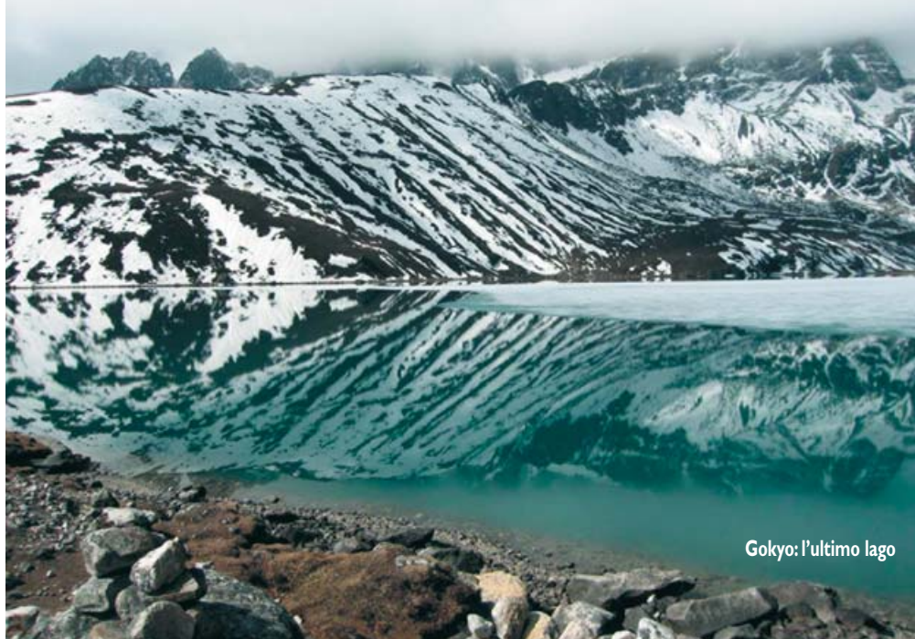
Gokyo: l'ultimo lago