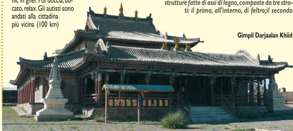
Gimpil Darjaalan Khiid

"In uno dei templi di Erdene Zuu, il monastero costruito sui resti della capitale dell'impero mongolo a Karakorum, è esposto un coltellaccio del XVIII secolo. Era usato per "recidere l'aorta ai nemici della religione", ossia gli atei e i miscredenti. I lama buddhisti non erano quei santi che l'Occidente immagina. Non sopportavano la diversità. Ci sono storie incre-