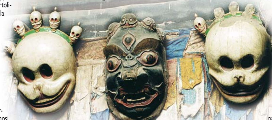
Maschere rituali a Hemis

ziosi broccati variopinti. Danzano simultaneamente compiendo balzi e rotazioni, tanto da assomigliare a vortici di puro colore immersi in uno scenario fatto di cielo, montagne e bianche abitazioni segnate dal tempo. Sotto un cielo tempestato di stelle, l'Indo o Singge Khababs, visto da qui sembra, secondo il significato tibetano, il fiume che scorre dalla bocca del leone. Seguito da creste frastagliate dall'aspetto tagliente, proseguo a ritroso per raggiungere il gompa di Alchi, noto come il complesso dei templi più bello del Ladakh. Pur avendo ormai fatto indigestione di iconogra-