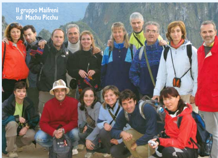
Il gruppo Maifreni sul Machu Picchu

Nei giorni successivi alla catastrofe ti accorgi pure che tutto il mondo è paese. Le polemiche per i telefoni saltati dopo che la terra ha tremato, uno stop durato un giorno intero, dominano i ripetuti dibattiti televisivi. Un confronto di disagi che all'occhio forestiero rivela tutta la sua assurdità. Ma in cui ogni volta inciampiamo. ■