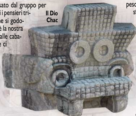
Il Dio Chac

Svacantamento è il termine usato dal gruppo per indicare cervello ripulito di tutti i pensieri tristi, pesanti, cattivi e menbra che si godono il meritato riposo. Da oggi è la nostra parola d'ordine! Traslochiamo alle cabanas vicino al sito di Tulum dove ci proponiamo di andare domani tutti insieme. Ognuno impiega il tempo come crede. L'appuntamento è per la sera a cena dall'imperdibile "Don Cafeto"! Scorpiacciata collettiva. Che pacchia!