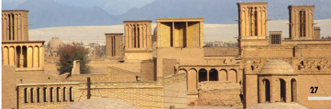
Panorama a Yazd

Chissà quale sollievo e recondito piacere per una carovana sulla via della seta vedere il profilo di questi condizionatori ecostostenibili. Sì, in questo modo mi sento di definirli, con un principio banalissimo (l'aria calda va in alto e quella fredda in basso) riescono a smorzare i 45 gradi estivi e rendere vivibili le case anch'esse costruite con mattoni di terra cruda. Camminare per la vecchia Yazd è il piacere di incontrare bambini curiosissimi e di vedere donne che assomigliano a triangoli neri. L'immagine che viene alla mente è quella di Belfagor che furtivamente si aggirava nei corridoi del Louvre. Donne ricoperte totalmente di pastrani e chador che non lasciano intravedere alcun ché, ma che camminando rapidamente fanno allargare in bas-