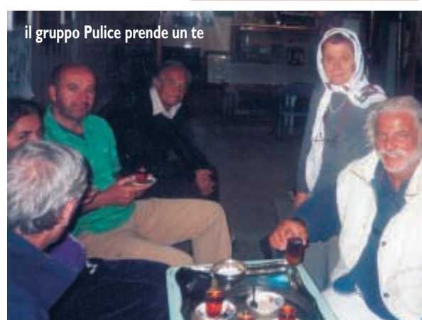
il gruppo Pulice prende un te

Di nuovo in marcia sul nostro comodo pullman, dove il notevole spazio a disposizione ha permesso a ciascuno del gruppo di scegliersi una sua postazione personale. Siamo diretti a Maku, presso il confine turco, chilometri e chilometri di territorio desertico. Verso sera sole radente sulla pianura brulla, breve sosta al bordo di un minuscolo villaggio. Una manciata di casupole di mattoni crudi, quasi escrescenze rettangolari e cubiche sul pendio sassoso cui sono abbarbicato. Sul breve camminamento che scende alla strada compagno, muti spettatori incuriositi, alcuni abitanti, uomini e donne di aspetto contadino e contegno dignitoso. Il gruppo di bambini, che infine ci si accosta, ha sorrisi perplessi. Uno tra loro, occhi grigi e lineamenti delicati, mi fissa a lungo con aria corrucciata. E' evidente che qua l'occidentale è una presenza ancora molto rara. Ma infine ridono e alzano una mano in segno di saluto mentre il pullman si appresta a ripartire.