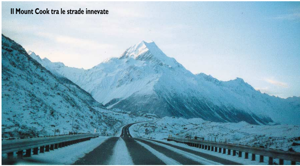
Il Mount Cook tra le strade innevate