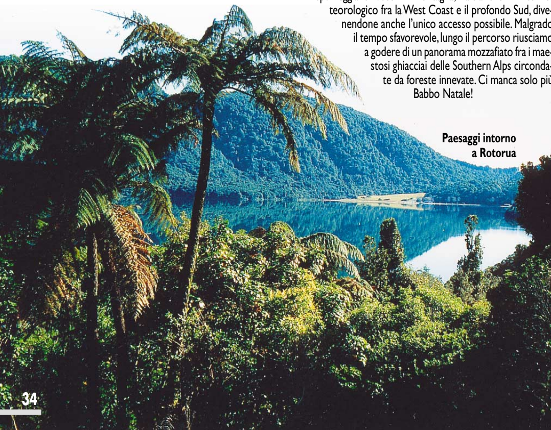
Paesaggi intorno a Rotorua

Al di là del passo, che abbiamo attraversato a passo d'uomo a causa delle abbondanti nevicate, si apre un altro mondo, sul quale, verso Wanaka e la zona dei laghi glaciali di color turchese, attraversando gli scenari del film Il Signore degli Anelli, il sole fa finalmente capolino fra le nuvole lasciate alle nostre spalle. Qui il paesaggio è superbo, con montagne di granito coperte di neve, pareti a picco ove l'acqua sgorga dappertutto, formando migliaia di cascate che si tuffano nella vegetazione tropicale.