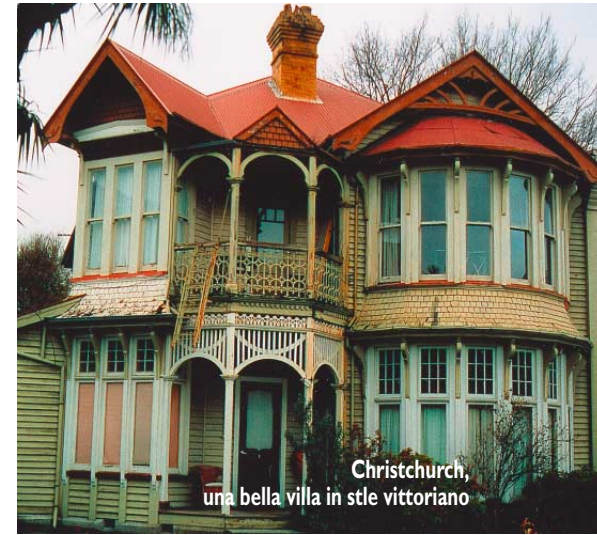
Christchurch, una bella villa in stile vittoriano

non volano, come il kiwi, completamente muto e con uno strano becco lungo, e l'uccello lira, convivono con il tuatara, il rettile più piccolo del mondo, dalle origini immemorabili, fiori microscopici e piante giganti. Colline verdi e sconfinite praterie permettono l'allevamento di più di venti tipi diversi di pecore, dalla lana pregiatissima e candida. Fra i tanti frutti ce n'è uno che ha reso la Nuova Zelanda famosa nel mondo, e porta lo stesso nome del simpatico uccello notturno locale: il kiwi.