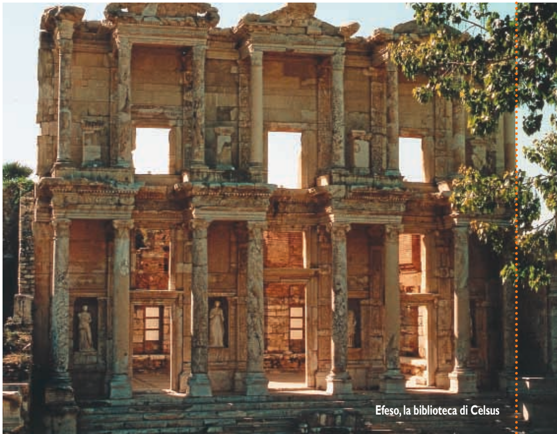
Efeso, la biblioteca di Celsus

Il terzo simbolo della città è la Moschea Blu, così chiamata per le favolose maioliche di Nicea di colore azzurro, che decorano la cupola e la parte superiore delle pareti. Costruita nel XVII secolo, è celebre per le sue cupole minori digradanti a terrazza e per i sei altissimi minareti che ne fanno risaltare il profilo, donandole proporzioni armoniose. Originariamente fu concepita come grande complesso per installarvi un ospedale, un refettorio per dis-