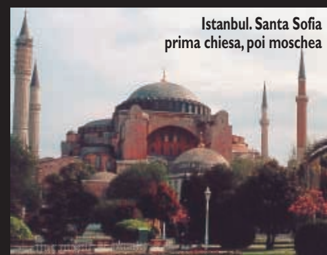
Istanbul. Santa Sofia prima chiesa, poi moschea

mente il più vasto del mondo, con quasi ventimila botteghe e l'inquietante labirinto dei suoi duecento vicoli e stradine frenetiche, dove la scrittrice si confondeva tra la moltitudine della gente come un personaggio anonimo in cerca di qualche pezzo d'antiquariato, o semplicemente di ispirazione.