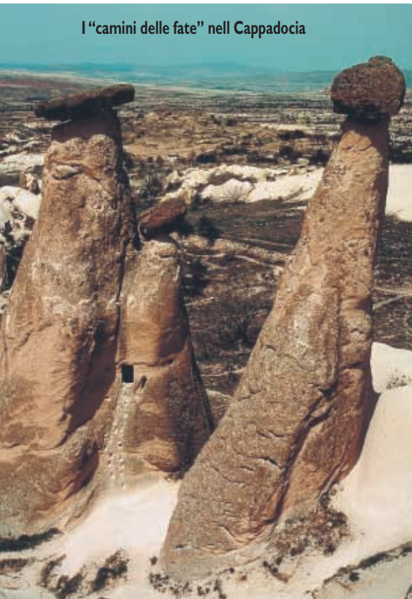
I "camini delle fate" nell Cappadocia

zionali; anzi, la strana mescolanza tra il nuovo e l'antico, fusi insieme in una sintesi, le danno il fascino di una capitale cosmopolita.