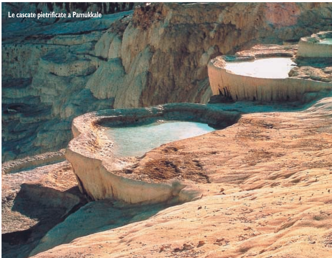
Le cascate pietrificate a Pamukkale

grandi terme di Hierapolis, città-necropoli romana fondata nel II secolo a.C. Dopo una breve visita di Afrodisia, anch'essa importante per essere stato uno dei maggiori centri termali greco-romani, ma nel cui sito archeologico predomina soprattutto l'immenso stadio, raggiungiamo la cittadina di Efeso, che ha saputo proteggere la sua splendida architettura dedicata alla dea Artemide, risalente al III secolo.