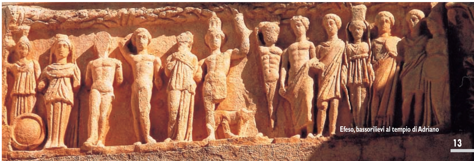
Efeso, bassorilievi al tempio di Adriano