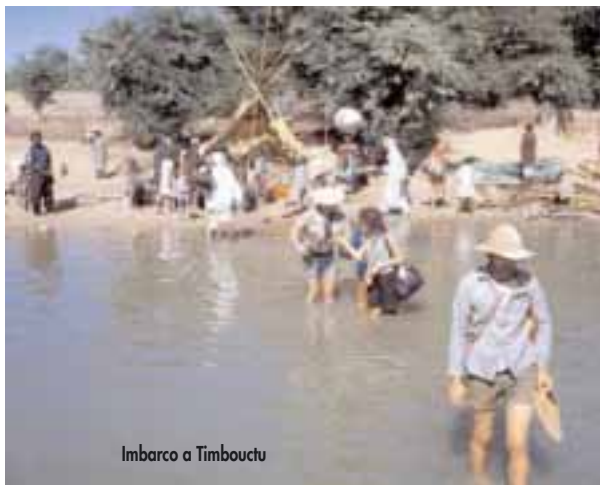
Imbarco a Timbuctù

aeroporto più a nord. Sul volo Bamako-Timbuctù non ci sono posti, si libereranno solo al primo scalo. E così viaggiamo negli odori della notte africana, cercando di precedere l'aereo. Arriviamo che è ancora buio, ci sdraiamo con i materassini sulle porte, così saremo i primi ad entrare. E facciamo bene, perché quando l'aereo atterra il capitano blocca tutto e ordina di pesare passeggero e bagaglio. Ha una scorta limitata di carburante e non può imbarcare più di un certo peso. A me va bene, sono l'ultimo ad esser accettato.