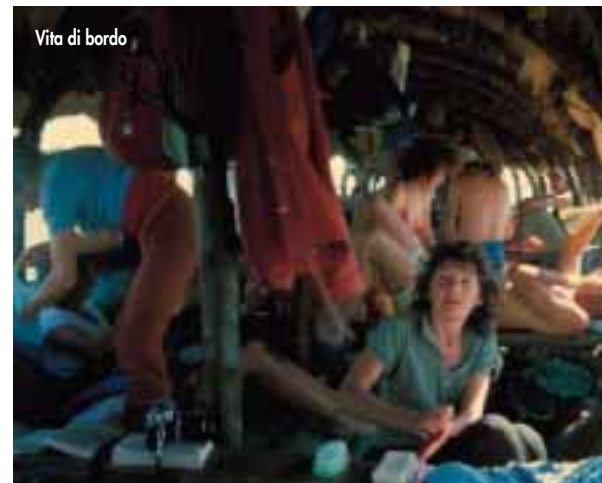
Vita di bordo

Scivolando fra le basse sponde prive di argini, ogni sera approdiamo in villaggi posti fuori dalla rotta del battello di linea. Di tanto in tanto ecco un gruppo di alberi, una piccola moschea dal profilo inconfondibile con le merlature coniche ed approdiamo fra misere capanne e casette. Chi ha la tenda scende a terra a sera per accamparsi, gli altri si stendono cercando di