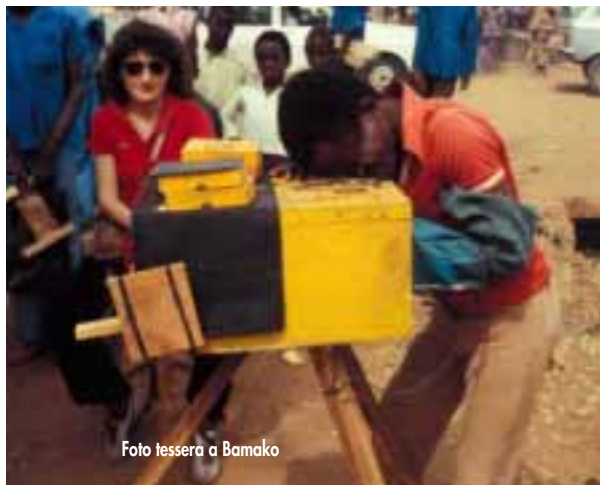
Foto tessera a Bamako

conformare la schiena alle lastre di sale su cui viaggiamo.